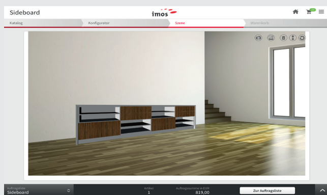
Einbindung der geplanten Artikel in realistische Umgebung.

Die Darstellung unter Berücksichtigung von Licht und Schatten zeigt in jeder Planungsphase eine fotorealistisch anmutende Darstellung. Die Bedienung ist intuitiv und selbsterklärend. Jederzeit kann virtuell durch die Räume spaziert oder vordefinierte Bewegungsabläufe abgerufen werden - wie das Öffnen von Türen und Schubkästen.